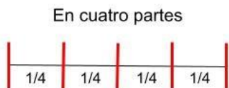
\frac{1}{4} de pulgada cada una de las 4 partes