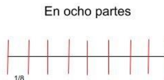
\frac{1}{8} de pulgada cada una de las 8 partes